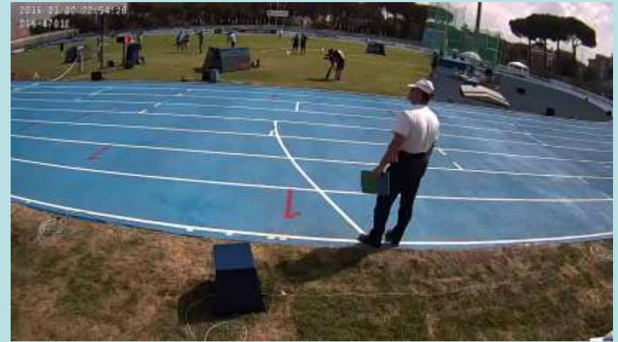
4x400 in uscita