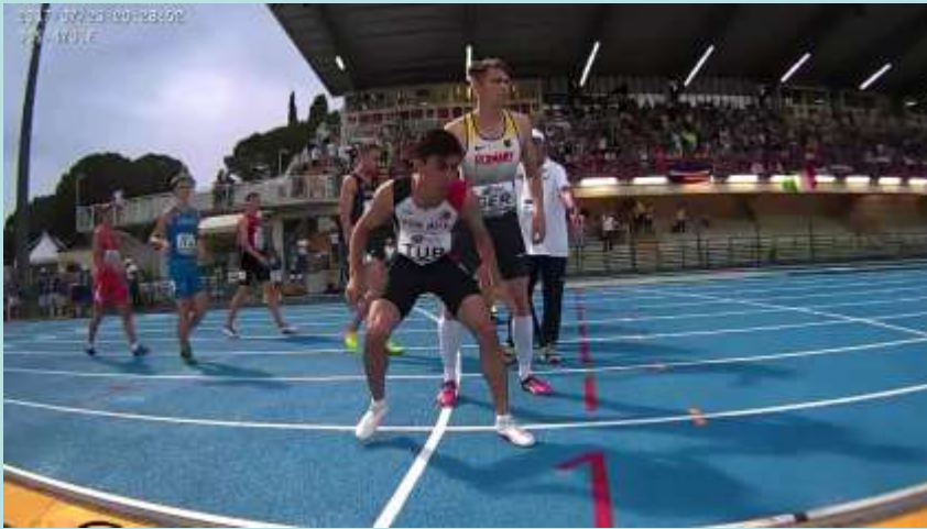
4x400 in entrata