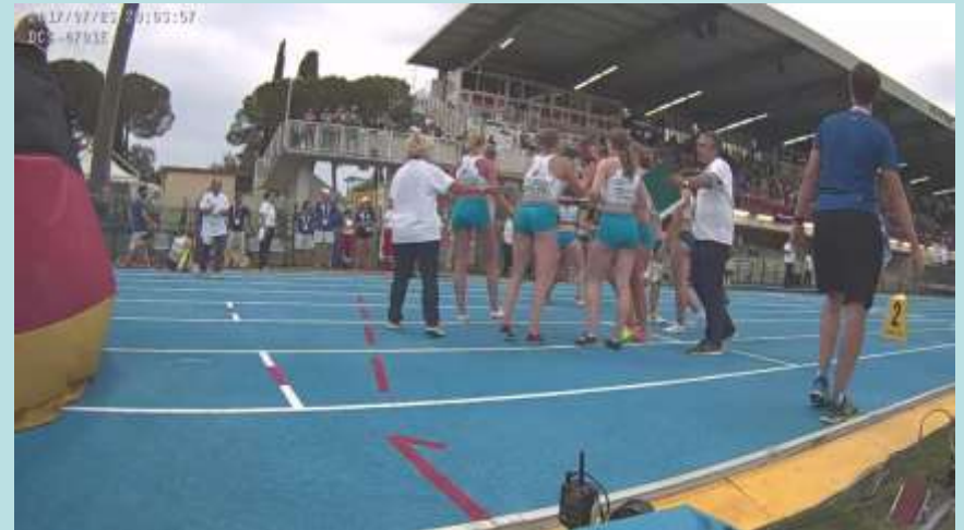
4x400 in uscita