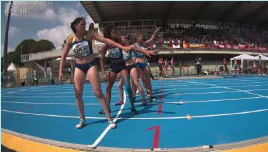
4x400 in entrata